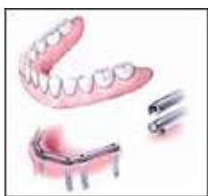
◀ Verankerung einer herausnehmbaren Prothese