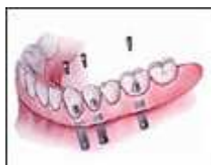
Verankerung einer Prothese ▶