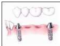
Befestigung einer Brücke ▶