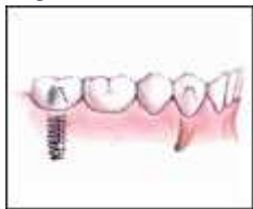
◀ Ersatz eines fehlenden Zahns

Zahnimplantate können eine effektive Methode darstellen, einen oder mehrere Zähne zu ersetzen. Jedes Implantat besteht aus einer Metallverankerung, die in den Kieferknochen eingebracht wird und einem hervorstehenden Pfeiler, auf dem ein künstlicher Zahn befestigt werden kann. An Implantaten können Brücken befestigt werden und Implantate können Teilprothesen ersetzen oder fest sitzende Prothesen verankern. Das Verfahren erfordert einen chirurgischen Eingriff und es kann bis zu einem Jahr dauern, bis die Behandlung ganz abgeschlossen ist.